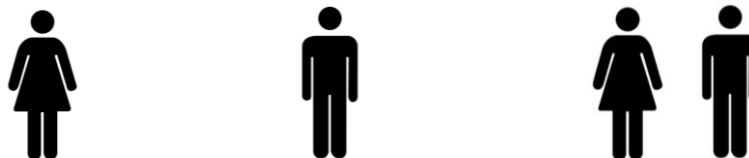
Figura 41 – Sanitário feminino Figura 42 – Sanitário masculino Figura 43 – Sanitário feminino e masculino

Nas portas de acesso aos sanitários deverá ser instalado símbolos representativos de sanitário, de acordo com cada situação, conforme item 5.3.5.3 da ABNT NBR 9050/2015 e detalhes em projeto.