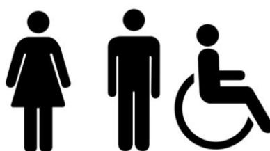
Figura 46 – Sanitário feminino e masculino acessível

Fig. Exemplo de sinalização de símbolos representativos de sanitário, conforme ABNT NBR 9050/2015.